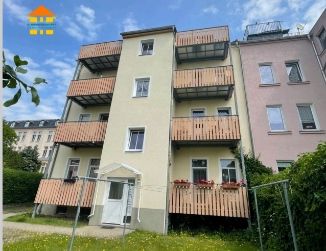
Oststraße 22 in 09212 Limbach-Oberfrohna