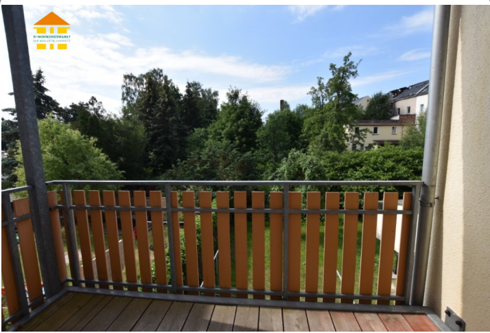
Balkon (Vergleich WE 3)