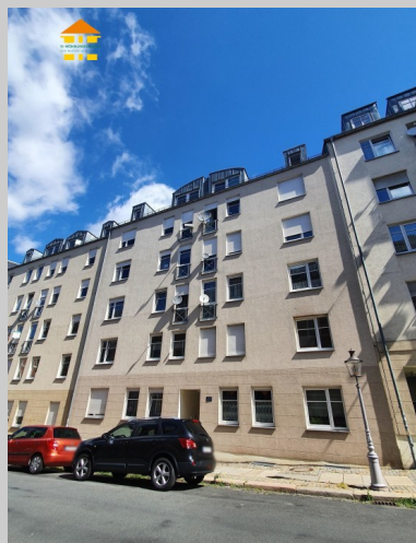
Gießenerstraße 27 in 09130 Chemnitz