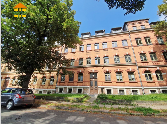
Ebersdorfer Straße 29 in 09131 Chemnitz