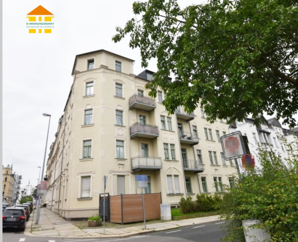
Winklerstraße 25 in 09113 Chemnitz