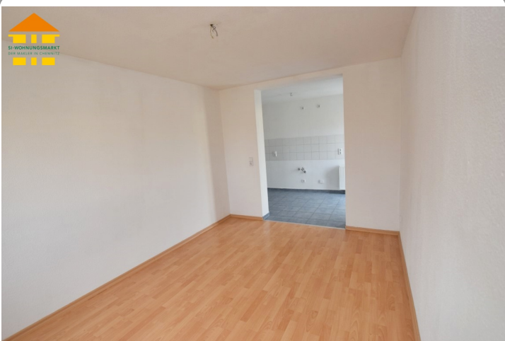
Wohnzimmer mit Zugang zur Küche