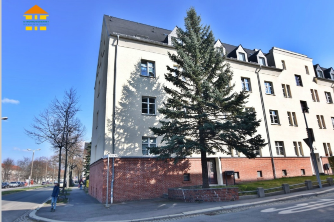
Grüner Winkel 1 in 09127 Chemnitz