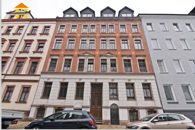
Philippsstraße 4 in 09130 Chemnitz