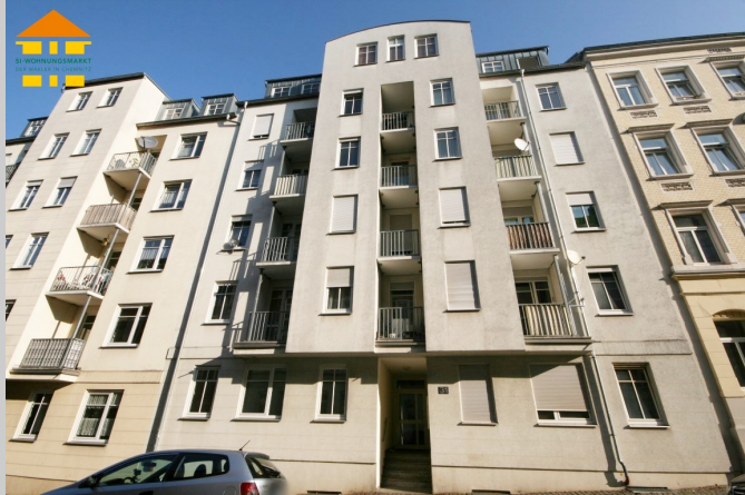
Gießelstraße 31 in 09130 Chemnitz