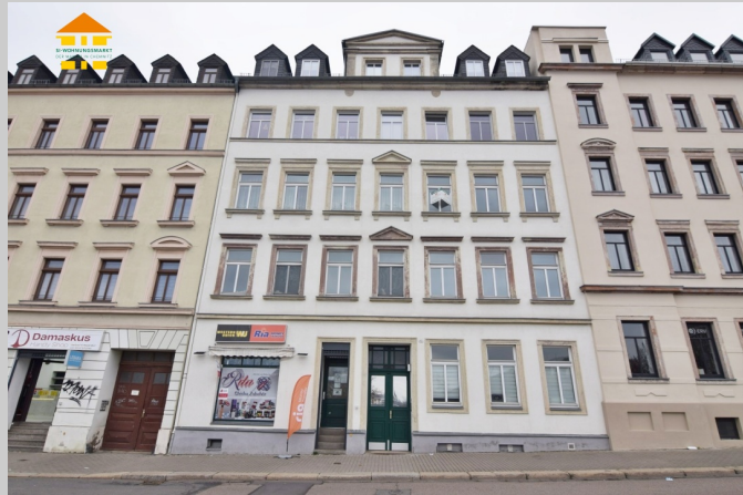
Hainstraße 52 in 09130 Chemnitz