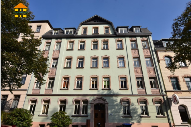
Zeistrae 2 in 09131 Chemnitz

Das Objekt befindet sich im schnen Chemnitzer Stadtteil Hilbersdorf. Besonders bei jungen Familien ist dieser Stadtteil, dank seiner idealen Lage und der zahlreichen Bildungseinrichtungen, sehr beliebt. Sowohl das Einkaufscenter "Sachsenallee", als auch zahlreiche sich im Stadtteil befindende Einrichtungen des tglichen Bedarfs, sind in wenigen Minuten erreichbar. Ein Groteil der Flche des beliebten Stadtteils wird von einem groen Waldgebiet, dem Zeisigwald, eingenommen. Somit ist man stets in nur wenigen Minuten, sowohl in der belebten Chemnitzer Innenstadt, als auch in der ruhigen und besinnlichen Natur.