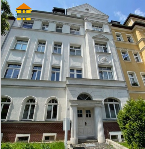
Cranachstraße 6 in 09126 Chemnitz