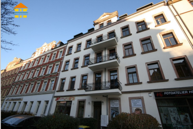
Weststraße 78 in 09112 Chemnitz

Der Kaßberg gehört zu den begehrtesten Wohnlagen in Chemnitz. Die zentrale Lage westlich der Innenstadt, die sehr gute Verkehrs-anbindung sowie die charakteristische Gründerzeit- und Jugendstilarchitektur prägen das Viertel. Sanierete Altbauten, eine ausgezeichnete Infrastruktur mit Einkaufsmöglichkeiten, Gastronomie, Ärzten und Schulen sowie begrünte Straßenzüge schaffen eine attraktive und zugleich ruhige Wohnatmosphäre.