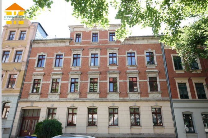
Ludwig-Richter-Straße 26 in 09131 Chemnitz