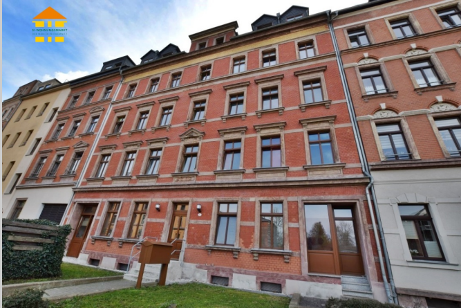
Ottostraße 6 in 09113 Chemnitz