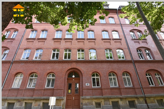
Klarastraße 32 in 09131 Chemnitz