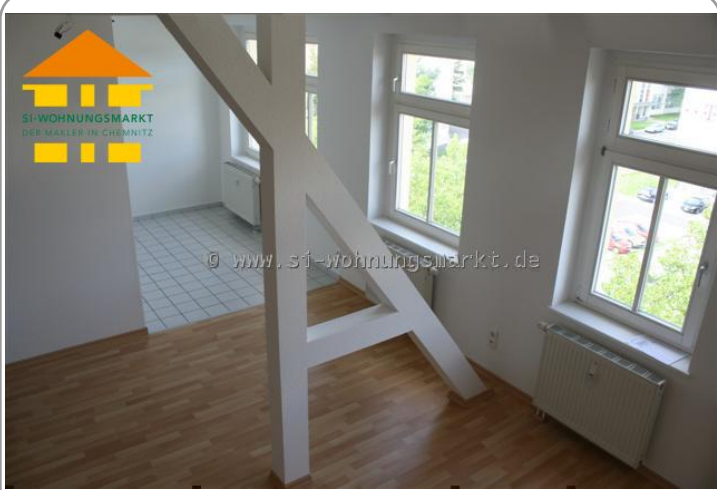
offenes helles Wohnzimmer