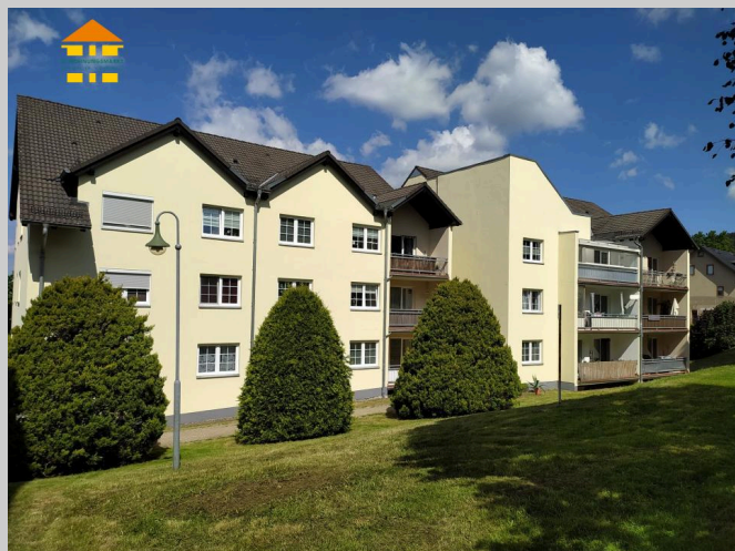
Lindenring 32 in 08315 Bernsbach