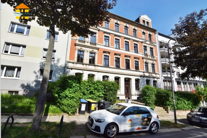
Barbarossastraße 34 in 09112 Chemnitz

Das Mehrfamilienhaus befindet sich in einem der größten Gründerzeit- und Jugendstilviertel Deutschlands - dem Kaßberg. Der unter allen Bevölkerungsgruppen beliebte Stadtteil zählt seit 1991 als Flächendenkmal. Im Laufe der vergangenen 20 Jahre hat sich der Kaßberg zu dem Place-To-Be in Chemnitz entwickelt. Zahlreiche kleine, ausgefallene und hippe Cafés und Restaurants sind das Aushängeschild des Kaßbergs.