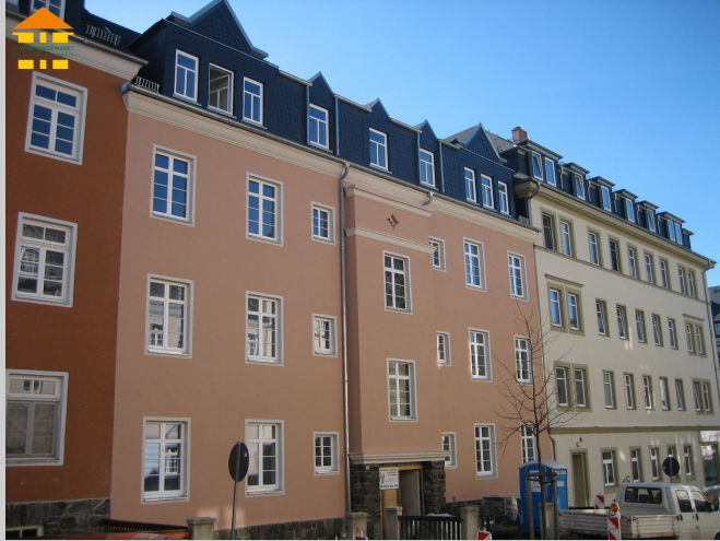
Helmholtzstraße 39 in 09131 Chemnitz