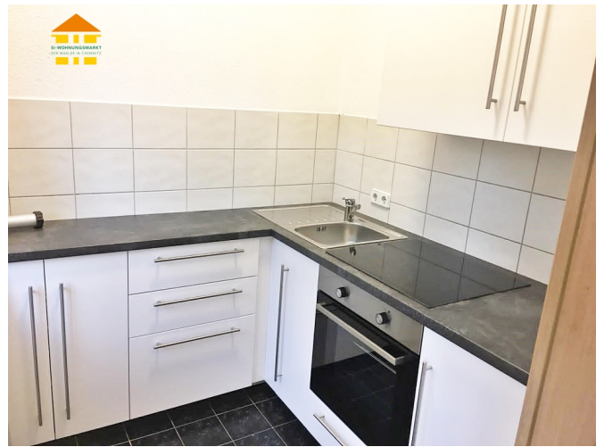
Küche inkl. Einbauküche