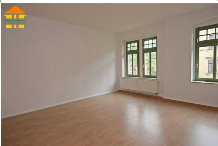
Wohn- / Schlafbereich