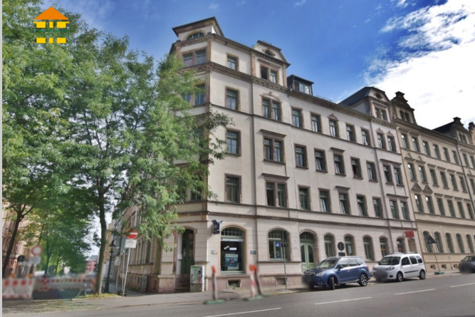
Fürstenstraße 47 in 09130 Chemnitz