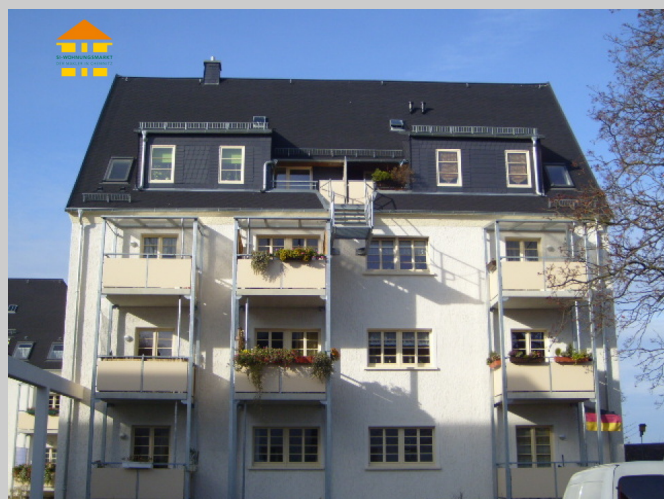
Heimgarten 57 in 09127 Chemnitz