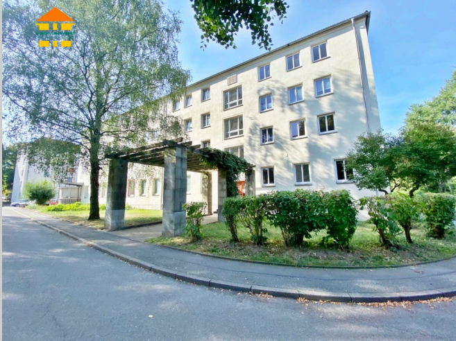
Lutherstraße 16 in 09126 Chemnitz