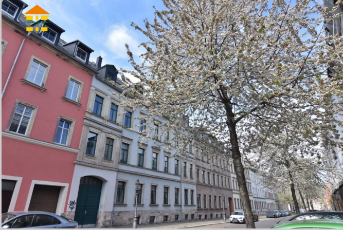
Lerchenstraße 3 in 09111 Chemnitz