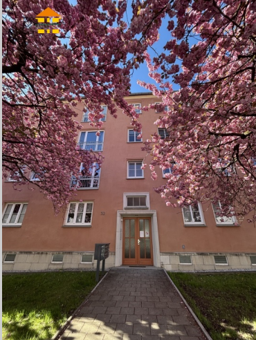
Lutherstraße 32 in 09126 Chemnitz