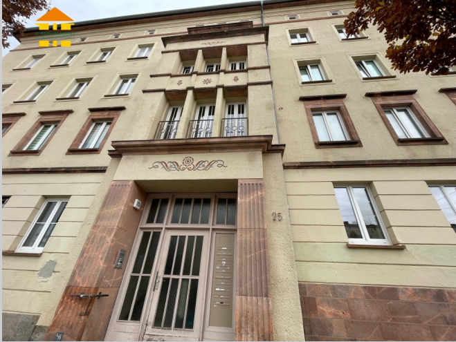
Reitbahnstraße 25 in 09111 Chemnitz