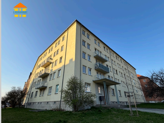
Lutherstraße 40 in 09126 Chemnitz