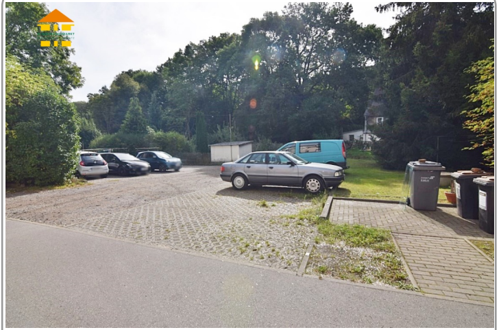
Stellplätze im Innenhof