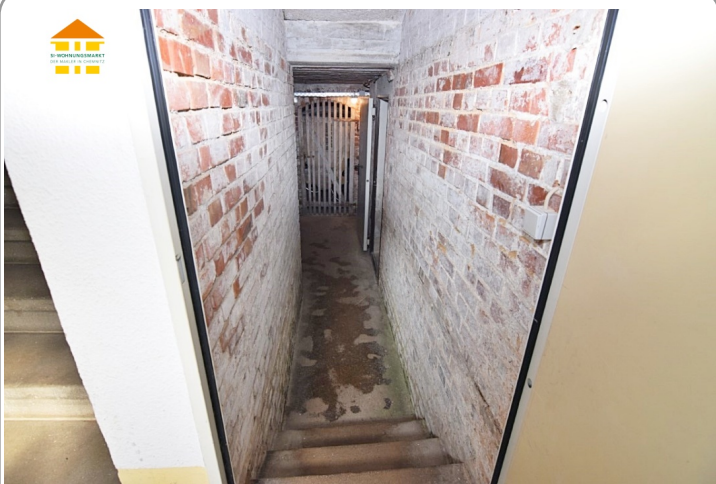
Zugang zum Keller