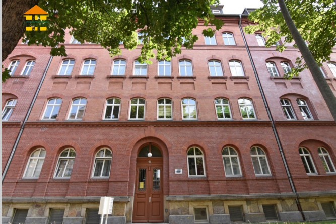
Klarastraße 32 in 09131 Chemnitz