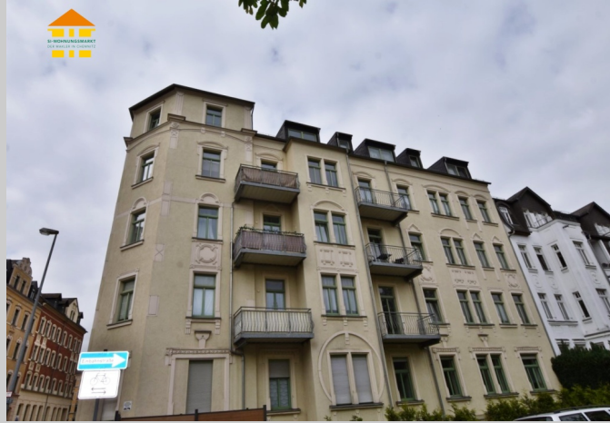
Winklerstraße 25 in 09113 Chemnitz