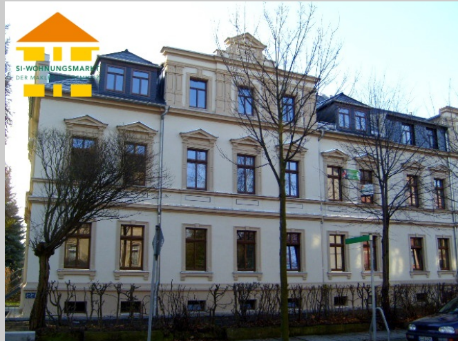
Margaretenstraße 1 in 09131 Chemnitz