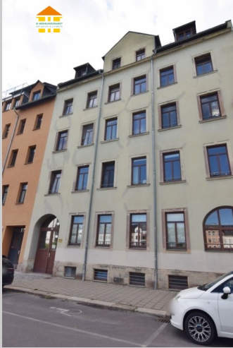
Johann-von-Zimmermann-Straße 25 in 09111 Chemnitz