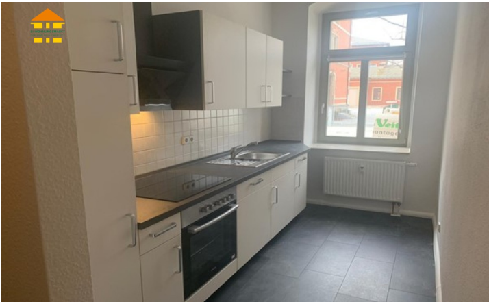
Küche mit Einbauküche