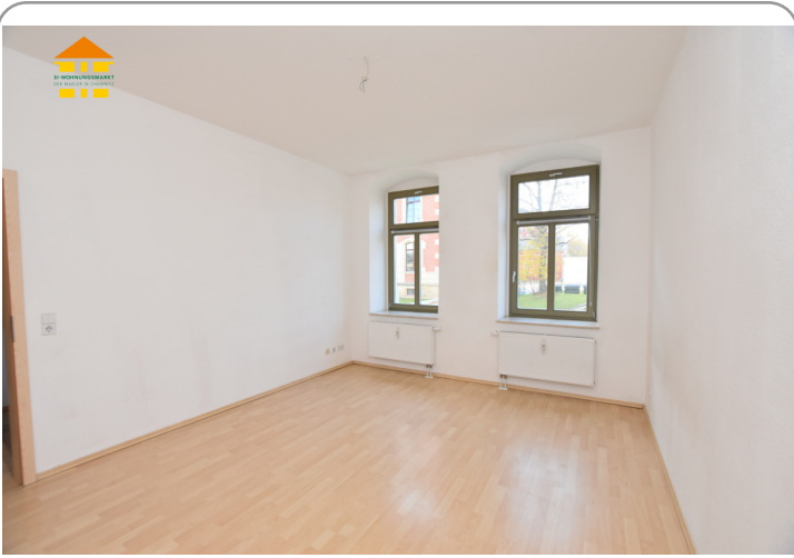
Wohn- und Schlafbereich