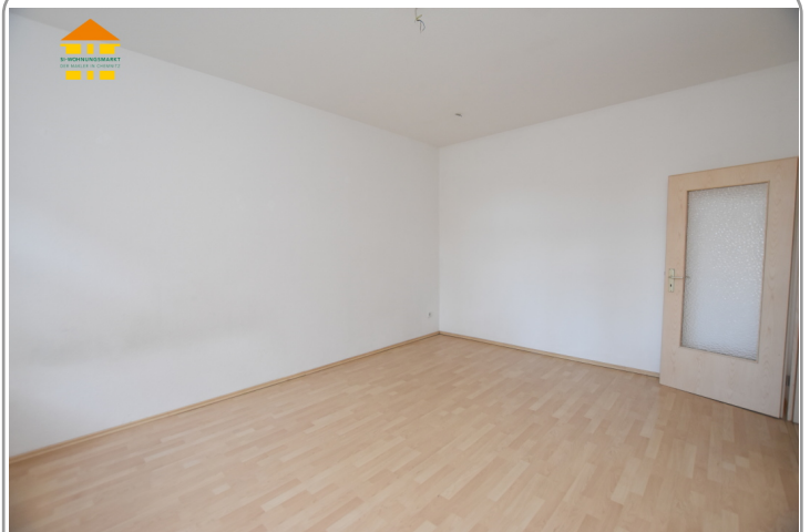
Wohn- und Schlafbereich