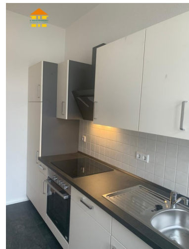
Küche mit Einbauküche