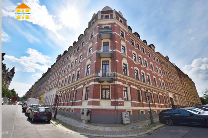
Ludwig-Kirsch-Straße 8 a in 09130 Chemnitz