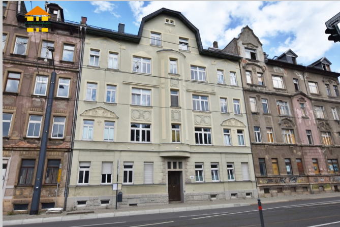
Bernsdorfer Straße 95 in 09126 Chemnitz