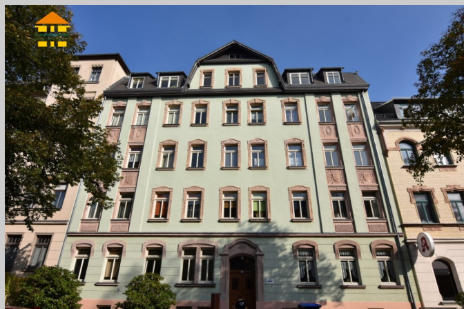
Zeißstraße 2 in 09131 Chemnitz

Das Objekt befindet sich im schönen Chemnitzer Stadtteil Hilbersdorf. Besonders bei jungen Familien ist dieser Stadtteil, dank seiner idealen Lage und der zahlreichen Bildungseinrichtungen, sehr beliebt. Sowohl das Einkaufscenter "Sachsenallee", als auch zahlreiche sich im Stadtteil befindende Einrichtungen des täglichen Bedarfs, sind in wenigen Minuten erreichbar. Ein Großteil der Fläche des beliebten Stadtteils wird von einem großen Waldgebiet, dem Zeisigwald, eingenommen. Somit ist man stets in nur wenigen Minuten, sowohl in der belebten Chemnitzer Innenstadt, als auch in der ruhigen und besinnlichen Natur.