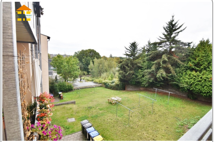
Blick auf den Hinterhof