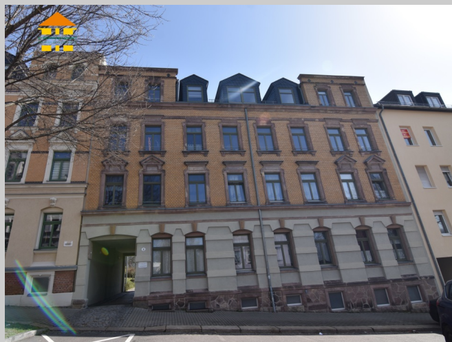
Mosenstraße 4 in 09130 Chemnitz