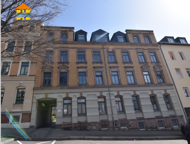
Mosenstraße 4 in 09130 Chemnitz