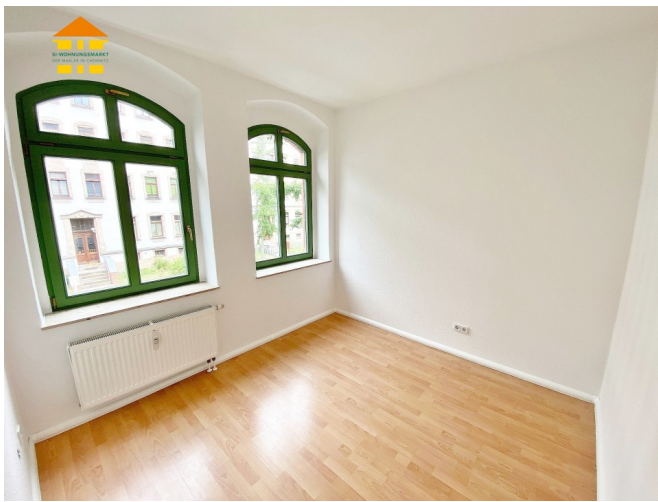
Kinder- oder Arbeitszimmer