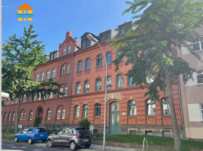
Margaretenstraße 41 in 09131 Chemnitz