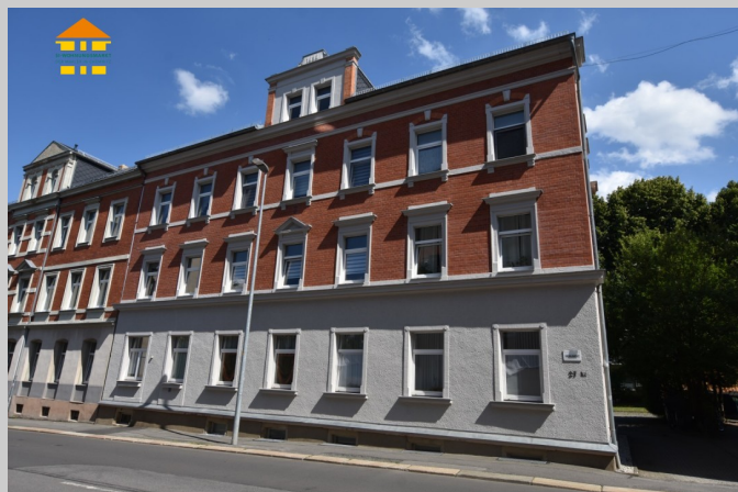
Augsburger Straße 27 in 09126 Chemnitz