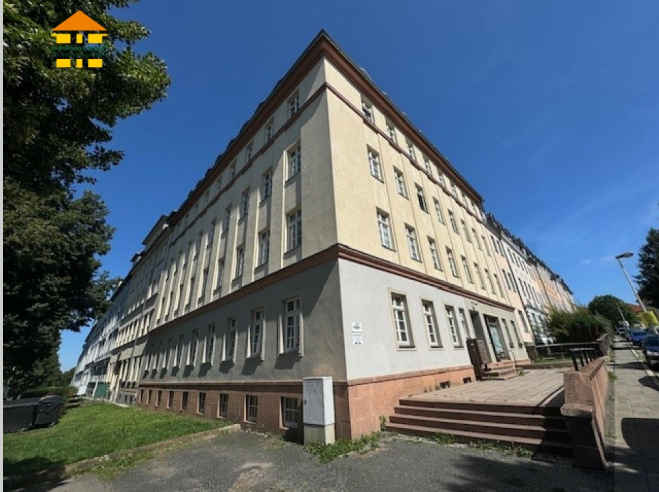
Helmholtzstraße 52 in 09131 Chemnitz