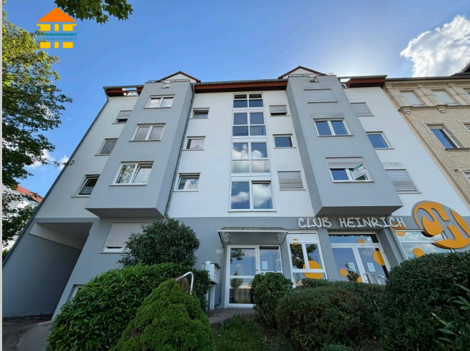
Heinrich-Schütz-Straße 90 in 09130 Chemnitz