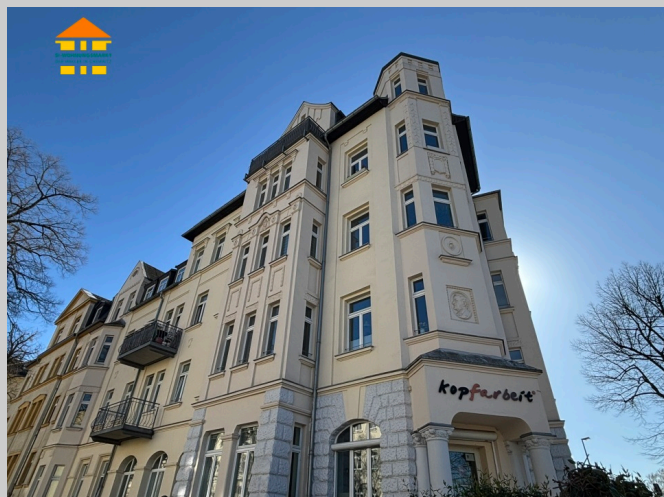
Neefestraße 89 in 09119 Chemnitz