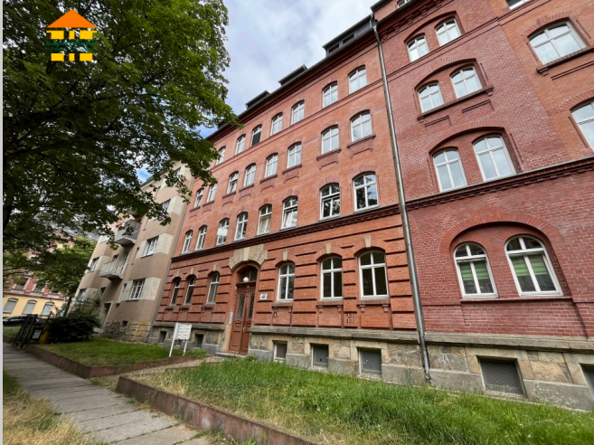
Klarastraße 42 in 09131 Chemnitz