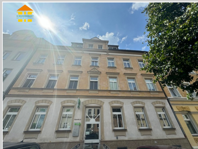
Kantstraße 18 in 09126 Chemnitz