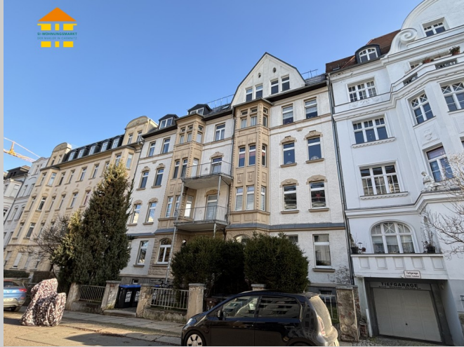
Erich-Mühsam-Straße 26 in 09112 Chemnitz