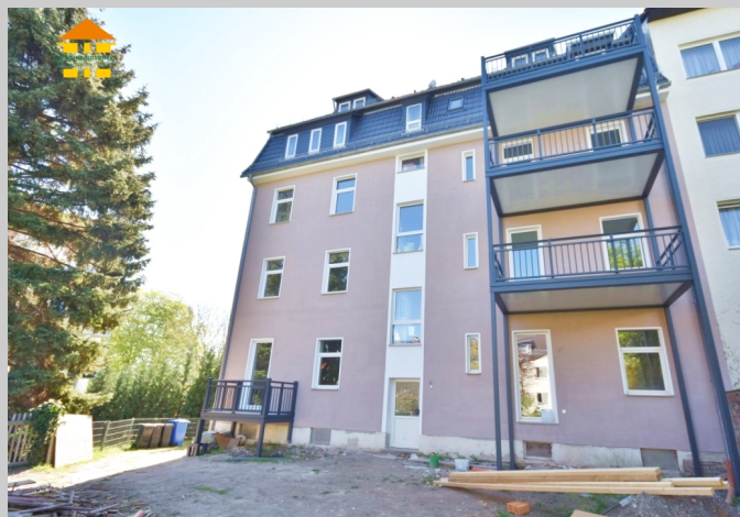
Lerchenstraße 37 in 08371 Glauchau