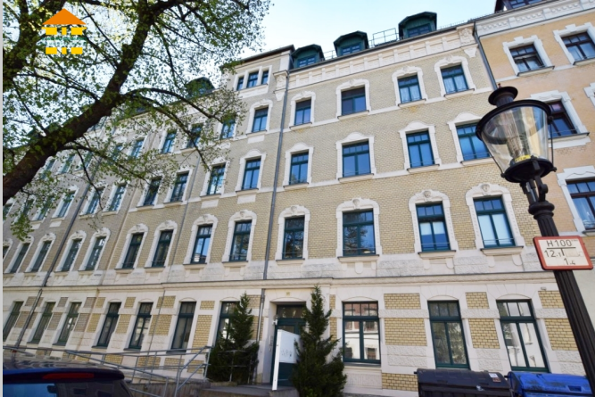
Glauchauer Straße 13 in 09113 Chemnitz