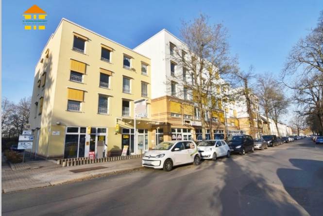
Neefestraße 38 in 09119 Chemnitz