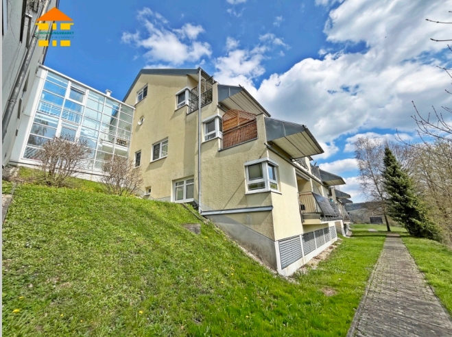
Amselring 15 in 09235 Burkhardtsdorf