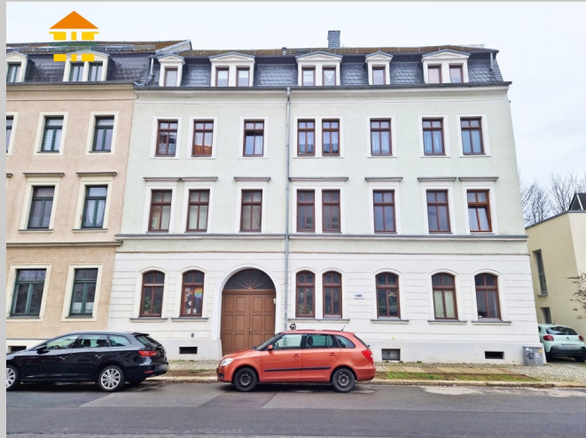
Eckstraße 13 in 09113 Chemnitz