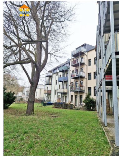
Garten und Rückansicht